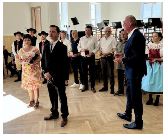
Slavnostní otevření sokolovny.