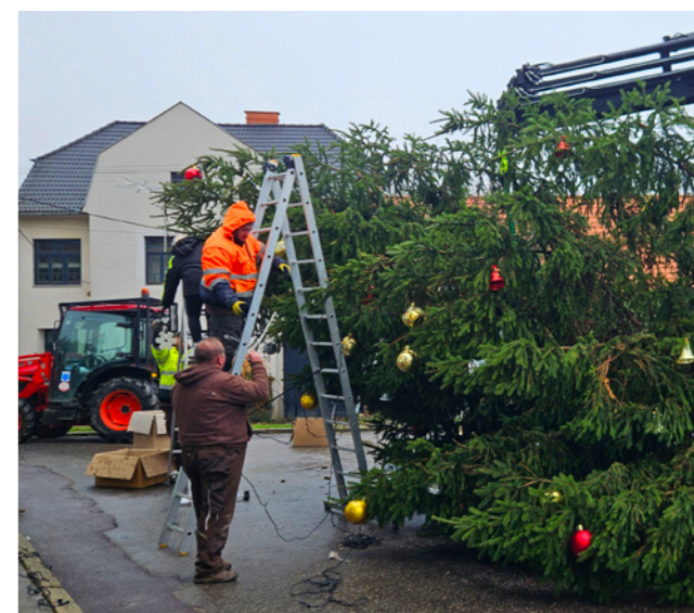
Umístění vánočního stromu.