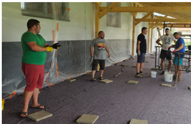
Nátěr pergoly u sokolovny místními členy sokola.