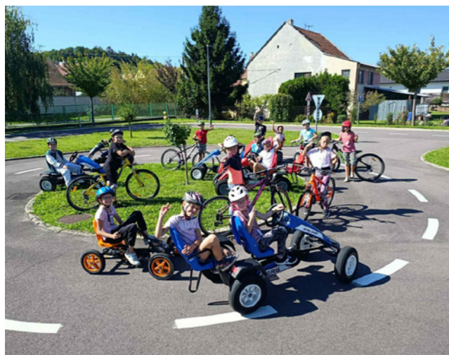
Dopravní hřiště Miroslav.