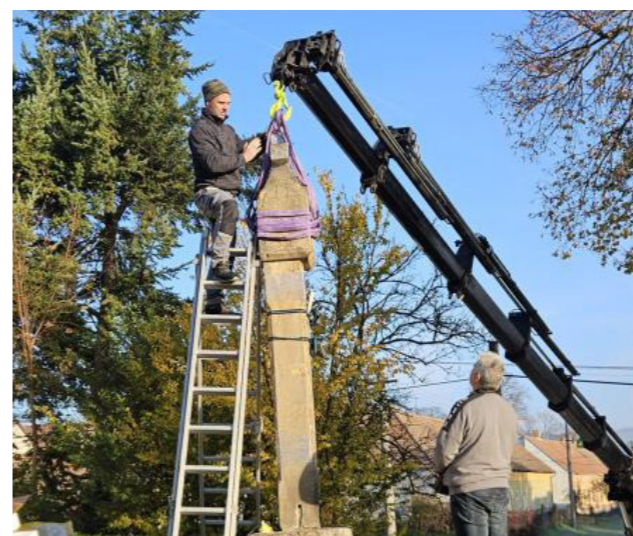
Zahájení renovace božích muk.