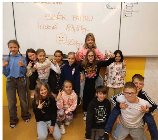
Vítězná 4. třída ve sběru starého papíru.