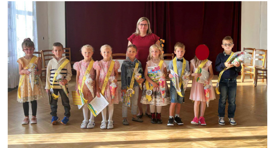
Prvňáci na radnici.