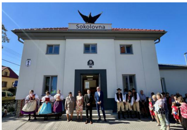
Slavnostní otevření sokolovny.