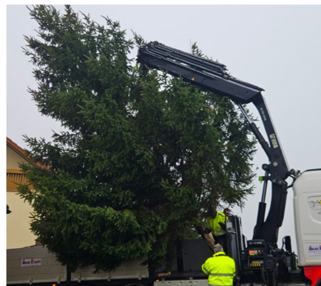
Převoz vánočního stromu.